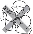
화상, 부상등의 노출위험